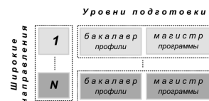
Рис. 1. Каркас архитектуры системы высшего образования

В архитектуре системы высшего образования содержится ряд концептуальных компонентов, но ее каркас, интересующий нас, можно представить вертикалью широких направлений (условно обозначенных номерами) с горизонталями уровней подготовки (рис. 1).